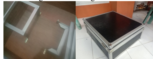
Gambar 2. Panel Box Genset

Sesudah desain disepakati maka dilanjutkan dengan membuat panel box terlebih dahulu lalu merangkai komponen di dalam panel box tersebut. Sehingga menjadi satu kesatuan Genset dengan sumber tenaga matahari.