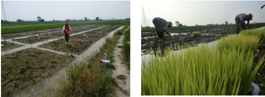
Gambar 4. Aplikasi jamur Trichoderma sebelum penanaman

pindahtanamkan ke lahan pertanian diaplikasikan sebagai pemeliharaan. Salah satu tujuannya adalah untuk mengendalikan penyakit yang menyerang tanaman padi mereka setiap kali penanaman. Hasil yang diperoleh dari pemberian trichoderma tanaman padi dapat tumbuh dan berkembang dengan lebih baik seperti terlihat pada gambar 4 berikut ini.