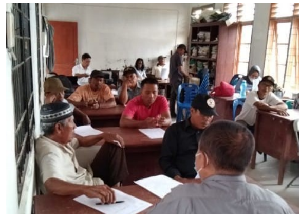
Gambar 2. Ceramah untuk menjelaskan tentang pemanfaatan Biopestisida

Langkah awal kegiatan ini menjelaskan kepada anggota/peserta kelompok tani cara yang sederhana bagaimana cara memperbanyak agen hayati trichoderma sebagai bio pestisida yang dapat digunakan untuk mengendalikan berbagai jenis hama dan penyakit pada tanaman padi serta perbanyak agen hayati metarhizium sebagai biopestisida yang berguna untuk mengendalikan hama dan penyakit pada tanaman padi. Kedua jenis jamur ini diperbanyak tujuannya adalah untuk mengurangi penggunaan pestisida kimia dan mengurangi dampak negatif akibat penggunaan pestisida kimia antara lain mengurangi dampak resistensi terhadap hama dan penyakit dengan menggunakan teknologi sederhana. Kegiatan ceramah dan diskusi seperti terlihat pada Gambar 2.