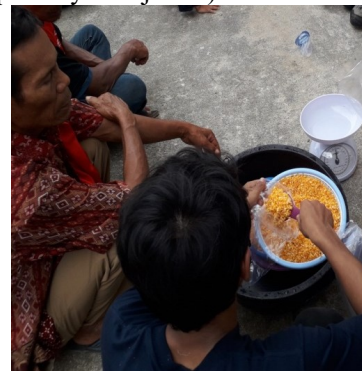
Gambar 3. Perbanyak Jamur Trichoderma dan Metarhizium

Praktek perbanyak agen hayati Trichoderma dan Metarhizium yang telah dilaksanakan dengan menggunakan media jagung berlangsung selama 15 hari, akan menjadi produk trichoderma dan metarhizium yang siap pakai. Adapun urutan pekerjaan yang dilakukan dalam perbanyak tersebut seperti terlihat pada gambar 3. (persiapan mediaperbanyak jamur).