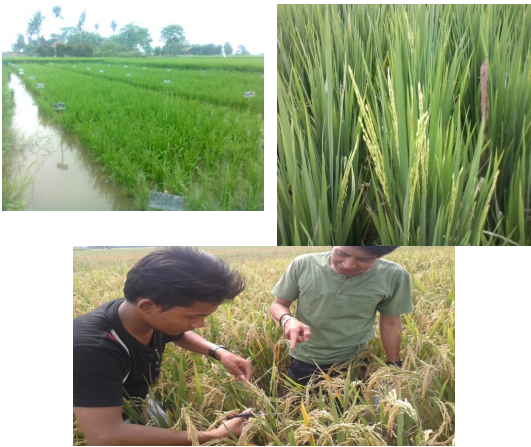
Gambar 5. Tanaman Padi Setelah diberikan Trichoderma dan Metarhizium