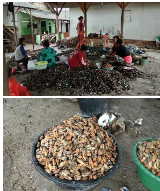
Gambar 4. Kegiatan pengolahan value added product hasil laut

Berdasarkan pertimbangan bahan baku, kemudahan produksi dan potensi pasar, diputuskan produk-produk yang akan diolah meliputi, aneka snack, abon, kerupuk dan produk-produk lainnya disesuaikan dengan dinamika dilapangan. Kegiatan Pengolahan value added product hasil laut dapat dilihat pada Gambar 4.