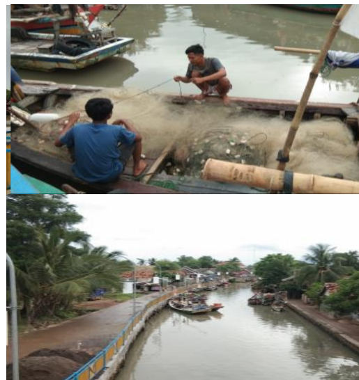
Gambar 3. Kondisi eksisting penduduk Kampung Tanggul Indah

Salah satu penyebab rendahnya perekonomian masyarakat nelayan adalah minimnya pengetahuan dan keterampilan dalam mengolah hasil laut. Banyak nelayan di Kampung Tanggul Indah yang mendapatkan hasil laut namun tidak laku dijual sehingga limbah hasil laut tersebut pada akhirnya dibuang dan mencemari lingkungan. Tidak hanya itu, masyarakat nelayan dalam melakukan kegiatan ekonomi hanya mengandalkan kemampuan suami dari hasil mencari ikan di laut sehingga menyebabkan ibu-ibu yang ada di kampung tersebut tidak melakukan kegiatan yang produktif. Kondisi eksisting penduduk Kampung Tanggul Indah dapat dilihat pada Gambar 3.