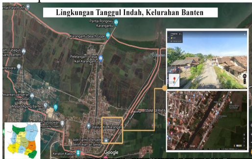
Gambar 2. Lokasi Kampung Tanggul Indah

Berdasarkan hasil survei pendahuluan di peroleh fakta bahwa Lingkungan pemukiman Tanggul Indah berjarak 2 km dari bibir pantai dengan ketinggian kurang dari 500 mdpl. Selain itu, lingkungan pemukiman ini berada cukup dekat dengan pasar pelelangan ikan (1,5 km) dan terdapat beberapa usaha budidaya ikan yang dapat mendukung perekonomian masyarakat pesisir. Lingkungan Tanggul Indah memiliki populasi kurang lebih 160 KK dengan rata-rata anggota keluarga 6 jiwa dan mayoritas penduduk bekerja sebagai nelayan. Lokasi lingkungan Kampung Tanggul Indah dapat dilihat pada Gambar 2.