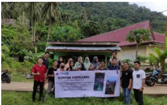
Gambar 3. Kegiatan pendampingan

dihasilkan. Berdasarkan pengamatan mereka, tim Lasker Muda melihat potensi yang besar dan menggali cumi-cumi sebagai salah satu cara masyarakat untuk mengembangkan potensi desanya dan pola pikir masyarakat untuk pengembangan Desa Air Bini lebih lanjut. Membangun pabrik pengolahan. Diharapkan dengan dibangunnya gedung produksi produk olahan cumi-cumi ini dapat mendorong kemajuan spiritual untuk meningkatkan taraf hidup masyarakat, yang merupakan tujuan akhir dari program Airbini sebagai desa wisata bangun desa.