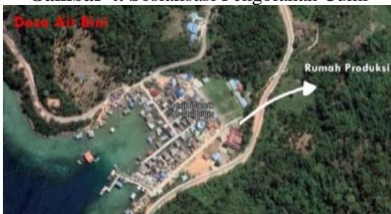
Gambar 5. Peta Lokasi pengabdian