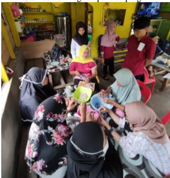
Gambar 4. Sosialisasi Pengolahan Cumi