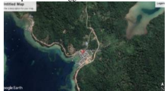
Gambar 2. Desa Air Bini

beberapa hal yang perlu ditindak lanjut kembali guna mengembangkan produk olahan cumi yang sudah ada. Berdasarkan hal tersebut pejuang muda mengadakan rumah produksi sebagai wadah pengolahan olahan cumi, langkah selanjutnya adalah membantu masyarakat mendistribusikan dan mengembangkan olahan produk, sertifikasi SNI, menjaga kehygienisan produk pra produksi hingga pasca produksi. Desa Air Bini di Kabupaten Kepulauan Anambas merupakan salah satu desa yang penghasilan lautnya adalah cumi dan termasuk desa pengolahan cumi kering yang ada di Anambas. Program pejuang muda yang dilaksanakan telah membuat perencanaan untuk pengembangan sumber daya alam yang ada di Kabupaten Anambas. “ Pejuang Muda adalah laboratorium sosial tempat mahasiswa dapat menerapkan ilmu dan pengetahuannya untuk membuat dampak sosial yang nyata ” (Siregar et al., 2022). Untuk itu fokus dari projek sosial Pejuang Muda ada empat bidang, yaitu: (1) Ekonomi Kreatif, (2) Pemberdayaan Masyarakat Miskin (3) Pengembangan Potensi Desa, dan (4) Pola Pikir Masyarakat. Keempat bidang ini dipilih karena merupakan kebutuhan esensial yang diperlukan di Daerah terluar, terdepan dan tertinggal