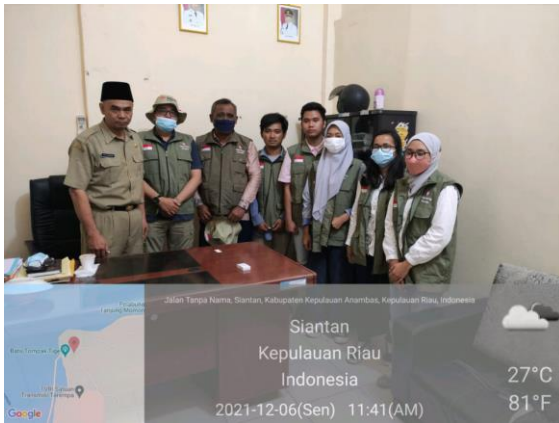
Gambar 5. Proses sosialisasi