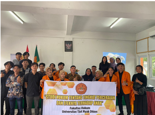
Gambar 2. Poto bersama telah selesainya kegiatan pengabdian pada masyarakat dengan tema studi hukum tentang tingkat perceraian dan efeknya terhadap anak.