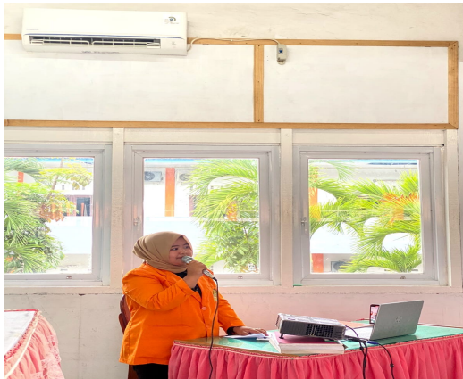
Gambar 1. Kegiatan berlangsungnya pengabdian pada masyarakat yang di laksanakan oleh mahasiswa/i Fakultas Hukum Universitas Tjut Nyak Dhien.

materi anak-anak mereka. Karena perceraian orang tua seringkali mengganggu pertumbuhan fisik dan mental anak-anak.