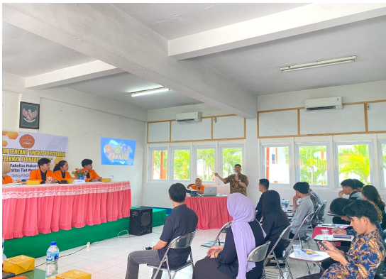
Gambar 3. Dosen sebagai pemateri memberikan uraian dan pemahaman mengenai

topik pengabdian pada masyarakat yang dilaksanakan di fakultas hukum Universitas Tjut Nyak Dhie.