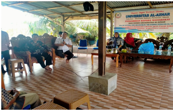
Gambar 2. Penyampaian Materi sosialisasi pemasaran produk olahan hasil hutan