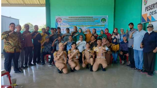
Gambar 6. Keseluruhan Peserta PKM

Foto keseluruhan peserta, narasumber, dan taruna Poltekbang Medan diperlihatkan pada Gambar 6. Taruna/ mahasiswa disertakan dalam kegiatan PKM untuk mendukung kegiatan agar dapat berjalan dengan baik. Selain itu, juga sebagai sarana latihan untuk meningkatkan dan keterampilan taruna dalam public speaking .