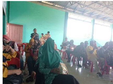
Gambar 5. Evaluasi Metode Tanya-Jawab

Sesi terakhir dari sosialisasi adalah evaluasi dari setiap kegiatan sosialisasi. Evaluasi dilakukan dengan dua metode, yaitu metode tanya-jawab serta metode pra-test dan post-test . Metode tanya-jawab dilakukan dengan memberikan pertanyaan seputar materi sosialisasi berupa aturan KKOP dan aspek hukum KKOP. Evaluasi tanya-jawab masyarakat diperlihatkan pada Gambar 5. Berdasarkan hasil evaluasi tanya-jawab bahwa masyarakat telah dapat menjawab seluruh pertanyaan dengan benar.