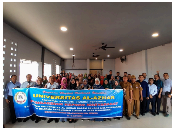
Gambar 3. Antusias warga Desa Manunggal dalam mengikuti sosialisasi

Berdasarkan hasil penyuluhan dan sosialisasi mengenai Tanaman Obat Keluarga yang telah dilakukan, dapat dilihat bahwa tingkat kesadaran dan pemahaman masyarakat mengenai manfaat dari Tanaman Obat Keluarga (TOGA) masih relatif rendah, hanya sebagian saja dari warga yang sudah mengetahui manfaat berbagai jenis tanaman obat. Dengan demikian melalui kegiatan ini sangat diharapkan masyarakat Desa Manunggal dapat lebih meningkatkan pengetahuan dan pemahaman mengenai jenis-jenis tanaman yang bisa dijadikan sebagai obat pendamping keluarga.