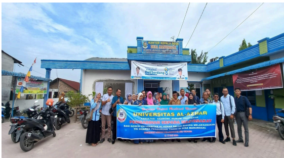
Gambar 2. Sosialisasi dan penyuluhan mengenai pemanfaatan lahan pekarangan dengan penanaman tanaman obat keluarga (TOGA)

Setelah dilakukan survei, wawancara, dan diskusi, rangkaian kegiatan yang dilakukan pada pengabdian kepada masyarakat ini selanjutnya adalah sosialisasi berupa penyuluhan dan pelatihan dengan penanaman tanaman obat keluarga di lahan pekarangan warga. Penyuluhan bertujuan untuk memberi pengetahuan dan pemahaman kepada masyarakat Desa Manunggal tentang berbagai jenis tanaman obat dan apa manfaatnya bagi kesehatan dan pengobatan.