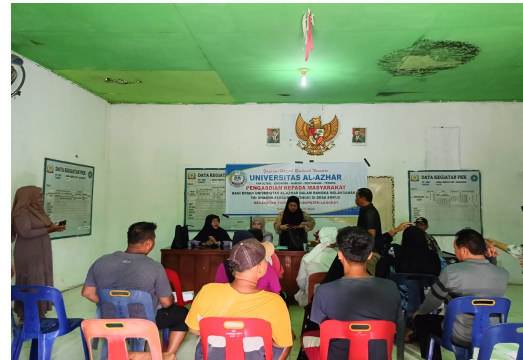
Gambar 5 Penyampaian Materi Bimbingan Teknis Perpajakan kepada Pelaku UMKM Desa Empus, Kecamatan Bahorok, Kabupaten Langkat

Harapan dari pelatihan ini adalah dengan adanya pengabdian kepada masyarakat ini dapat membuka wawasan bagi masyarakat khususnya pelaku UMKM di Desa Empus, Kecamatan Bahorok, Kabupaten Langkat, untuk dapat menerapkan pelaporan perpajakan. Sebelum pelaksanaan pelatihan peserta yang memiliki pengetahuan tentang perpajakan sebanyak 6 orang (20%), Sedangkan setelah pelatihan dilaksanakan peserta yang mengetahui sebanyak 22 orang (80 %) peserta telah memahami pajak dan membuat laporan perpajakan, mampu menghitung pajaknya dengan benar. Para peserta sangat antusias untuk mengikuti jalannya acara sampai selesai dengan aktif berdiskusi seputar pajak. Mereka berharap kegiatan ini bisa dilakukan secara terus-menerus sehingga kemampuan mereka meningkat terutama dalam perpajakan.