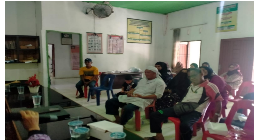
Gambar 1 Penyampaian materi