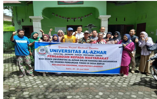
Gambar 2 Foto bersama