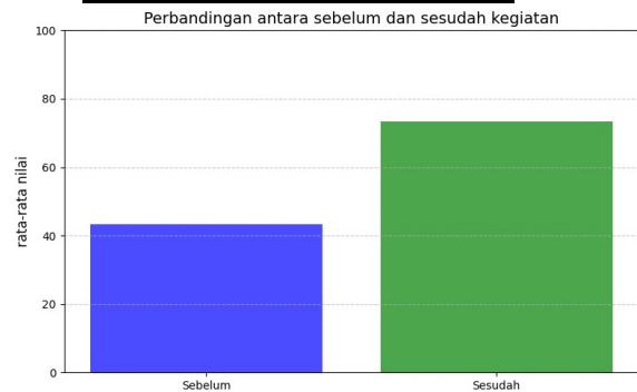
Gambar 3 grafik sebelum dan sesudah kegiatan