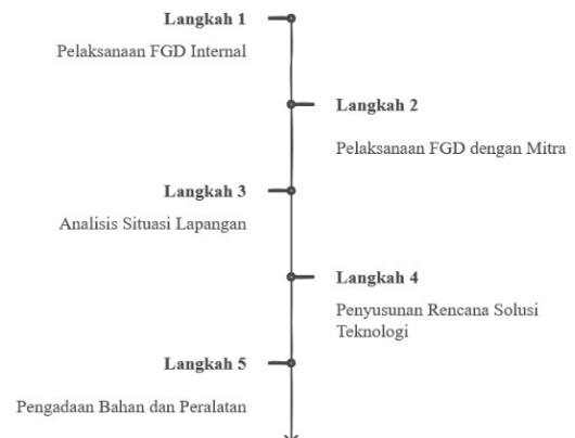
Gambar 1 proses diskusi pengolahan limbah udang