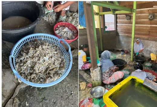
Gambar 4. Aktivitas Pengupasan Udang